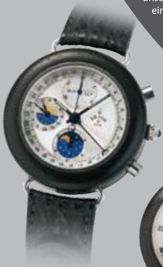
Cavalletto Chrono Ebenholz, Automatik € 3050,-