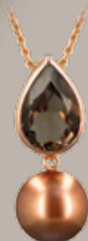
Anhänger € 498,- Kette € 198,-