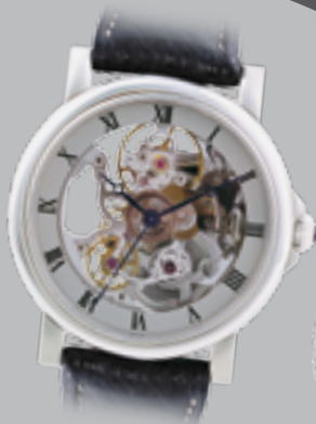
Tempio „Mechanik“ Handaufzug, € 995,-