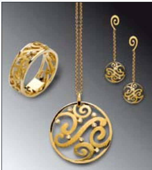
Edles Gelbgold 585 Ring, Diamant 0,04 ct, TW/SI, € 778,- Anhänger 0,06 ct, TW/SI, € 509,- Ohrhänger 0,04 ct, TW/SI, € 778,-