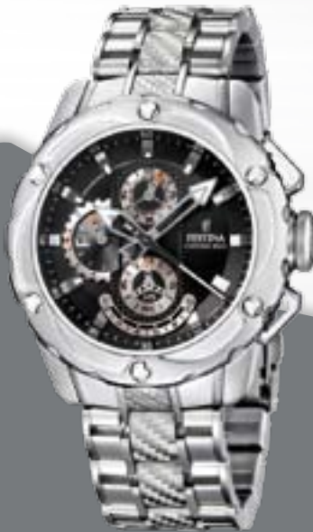
TOURCHRONO 09 Chronograph, Edelstahl, Datum, 1/20 Sek. Stoppfunktion, 10 ATM, wasserdicht