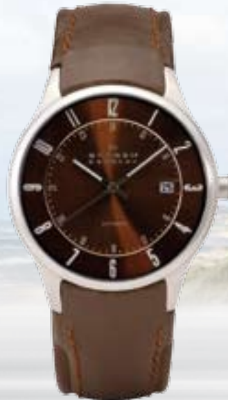
Automatik € 269,-