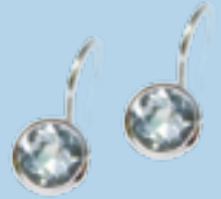
Weißgold 585, € 715,-