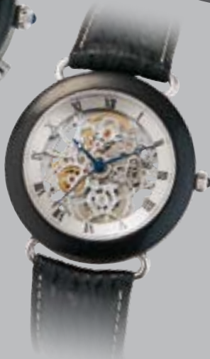
Cavalletto Ebenholz, Automatik € 2090,-