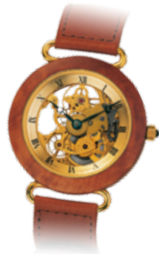
Tarlo Bruyereholz, Handaufzug € 1290,-