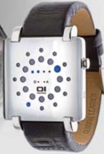
"Gamma Ray Square"

Join the O1 THE ONE's evolution. Du bist einzigartig, hast Dainen eigenen Geschmack und Deine individuelle Weltanschauung.