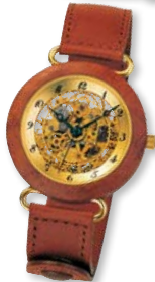
Tarlo Fin Calendrier Bruyereholz, Automatik € 2900,-