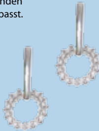
Weißgold 585, 0,20 ct W/SI € 690,-