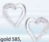
Weißgold 585, 0,10 ct W/SI € 215,-