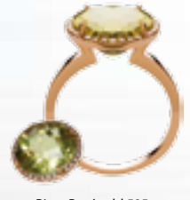
Ring, Roségold 585, Lemon Quarz, Diamant 0,14 ct € 798,-