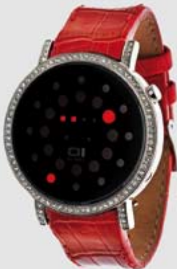
"Odins Rage Stone"