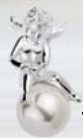
€ 179,- € 54,- bis € 189,- mit Kette

Kleine Liebesbeweise in Schmuck erfreuen unsere Herzen, vor allem wenn sie so symbolhaft daherkommen wie Preziosen von Heartbreaker.