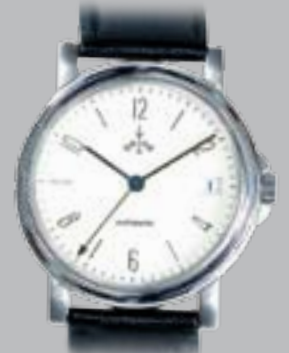
Tempio „Arabik“ Automatik, € 695,-