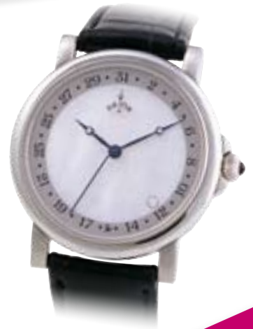
Automatik € 995,-