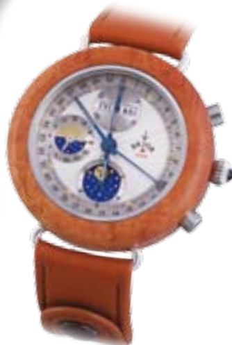
Tarlo Chrono Bruyereholz, Automatik € 3050,-