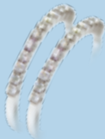
Weißgold 585, 0,26 ct W/SI je € 695,-