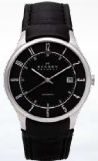
Automatik € 269,-