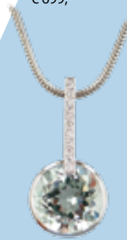
Weißgold 585, 0,065 ct W/SI € 699,-