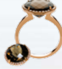
Ring, Roségold 585, Rauchquarz, Diamant 0,14 ct € 798,-