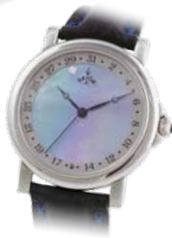
Automatik € 995,-