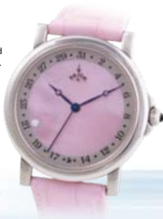
Automatik € 995,-