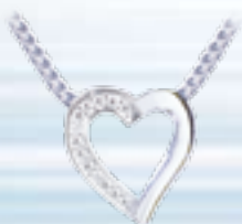
Weißgold 585, 0,10 ct W/SI € 130,-