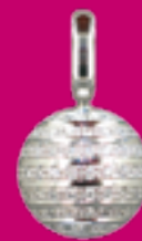
Magische Momente beschert der Kugelhänger aus Weißgold 585 mit 0,045ct W/SI Diamanten. € 1298,-