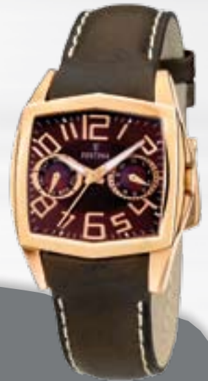
Multianalog, Edelstahl, rotvergoldet, wasserdicht