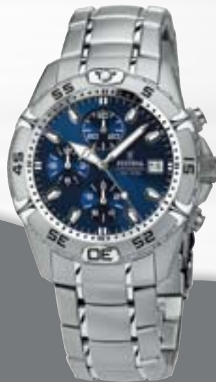
Chronograph, Wechselband, Edelstahl, Datum, 10 ATM, wasserdicht