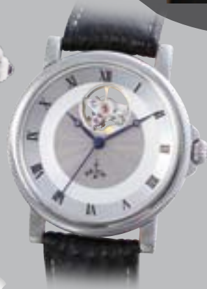
Tempio „Va Bene“ Automatik, € 1200,-