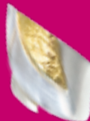
Silber 925, plattiert € 55,-