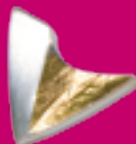
Silber 925, plattiert € 225,-