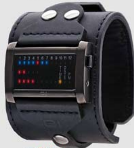
"Ibiza Ride Horizontal"