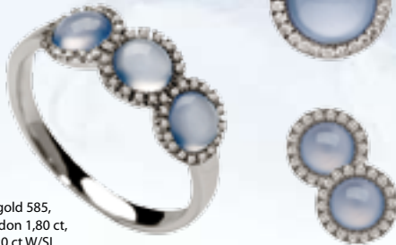
Ring, Weißgold 585, Blauer Chalcedon 1,80 ct, Diamant 0,20 ct W/SI, € 998,-