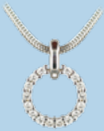
Weißgold 585, 0,24 ct W/SI € 635,-

Je nach Anlass und Outfit sind die Ringe ein funkeln-der Hingucker, der sofort ins Auge fällt und einen bezaubernden Eindruck hinterlässt, und sich bequem zum Trauring anpasst.