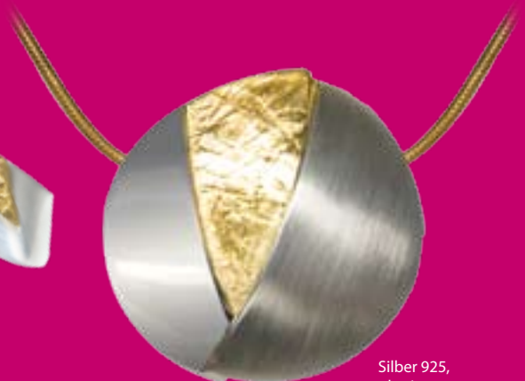
Silber 925, plattiert € 270,-